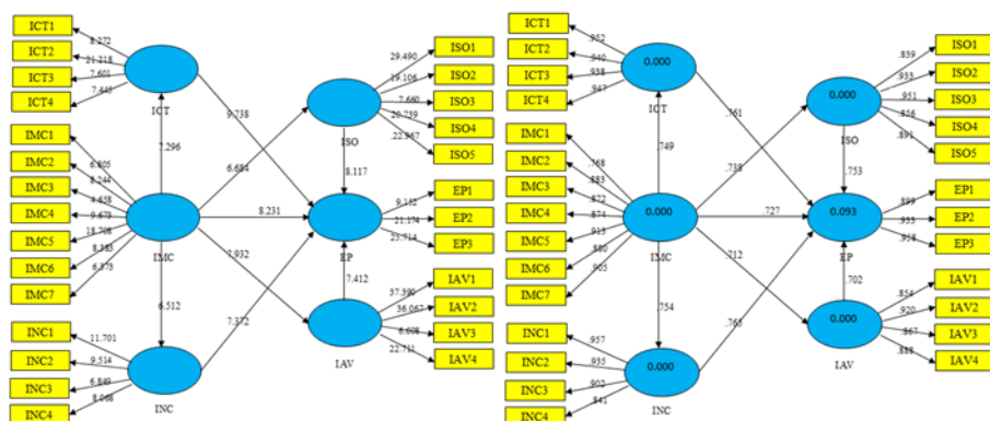
شکل ۲- آماره آزمون و ضریب همبستگی

برای آزمون صحت مدل تحقیق تئوری و محاسبه هماهنگ کننده‌های اثر، از روش مدل معادلات ساختاری با استفاده از نرم‌افزار PLS3 استفاده شده است. شکل زیر نشان دهنده مدل اجرا شده در نرم‌افزار می‌باشد. شکل راست نشان دهنده ضرایب مسیر و شکل چپ نشان دهنده آماره آزمون می‌باشند.