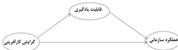
شکل ۱: مدل مفهومی تحقیق

رابطه بین گرایش کارآفرینی و عملکرد صادراتی به‌وفور در ادبیات تحقیق بررسی شده است. پژوهش حاضر قصد دارد تا علاوه بر بررسی تأثیر مستقیم گرایش کارآفرینی بر عملکرد صادراتی، اثر غیرمستقیم آن را از طریق قابلیت یادگیری به‌عنوان یکی از ابعاد مهم قابلیت‌های پویا بر عملکرد صادراتی در شرکت‌های کوچک و متوسط بسنجد. با توجه به ادبیات پژوهش و همچنین فرضیات مطرح شده، مدل مفهومی پژوهش در شکل ۱ نشان داده شده است. در این مدل متغیر عملکرد صادراتی به‌عنوان متغیر وابسته، قابلیت یادگیری به‌عنوان متغیر میانجی و گرایش کارآفرینی به‌عنوان متغیر مستقل مطرح شده است.