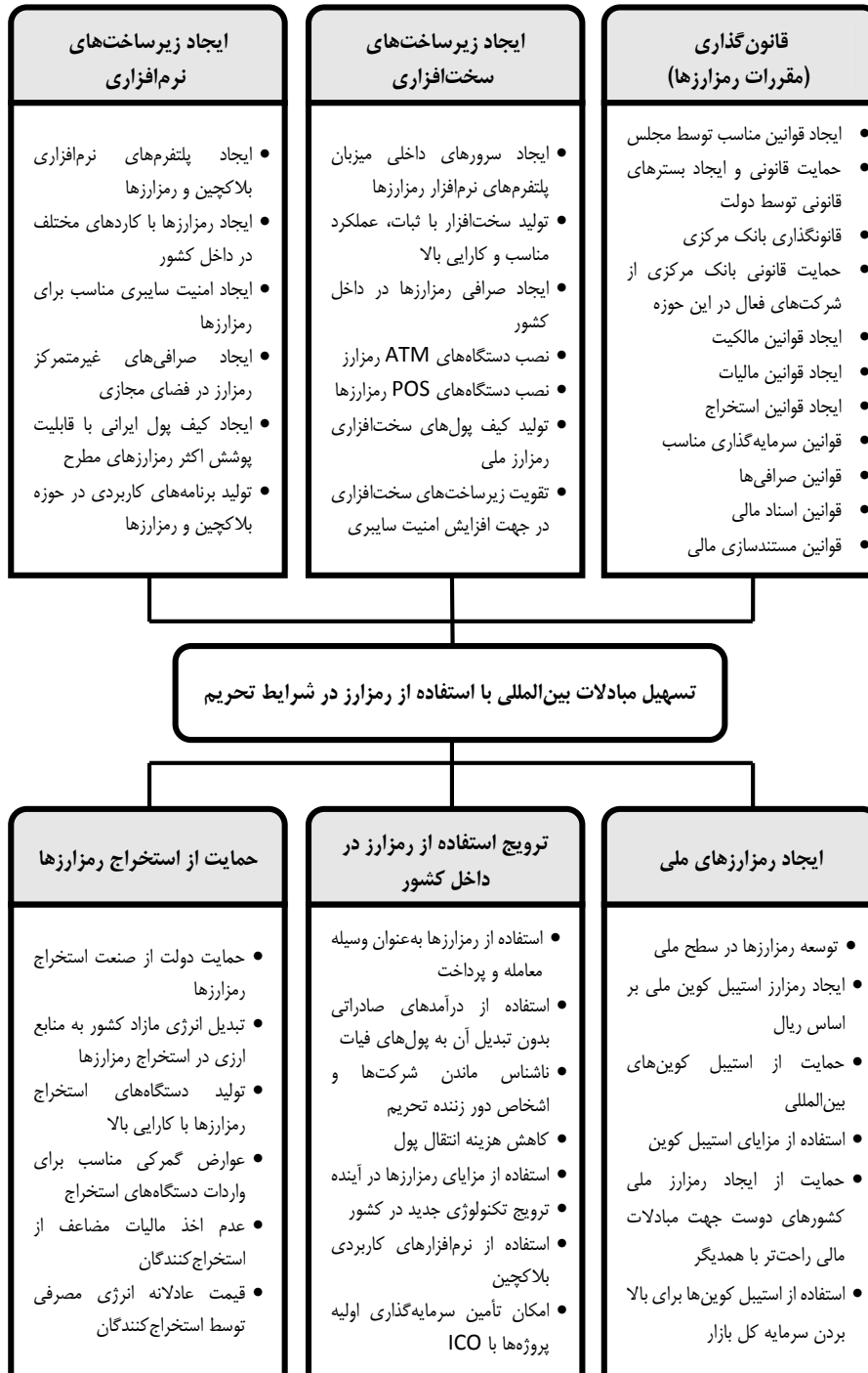
جدول ۲. پارامترهای مستخرج از مرحله اول